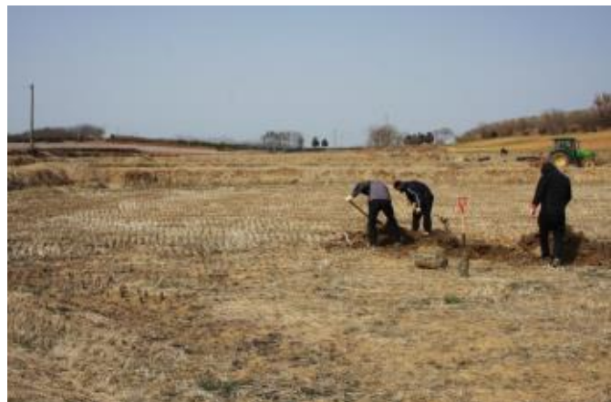
가곡통의 토양단면 및 분포지형

표토 - 0-18cm. 회갈색(2.5Y 5/2)의 미사질양토; 반문은 확연한 황적색(5YR 4/6)이고 작거나 보통이며 있음; 구조는 곤죽상태로 없음; 점착성과 가소성이 있음; 뿌리는 작거나 보통이며 많음; 공극은 작거나 보통이며 있음; 운모는 작고 적음; 경계는 평면상으로 확연함